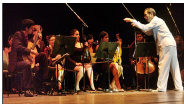
El maestro Leo Brouwer frente a la Orquesta de Cámara de La Habana

varias sedes de la capital cubana, donde coincidieron ejecutantes de España, Francia, Venezuela, Bosnia y Cuba.