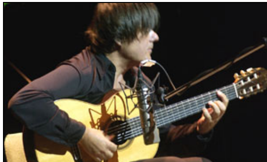
El bosnio Edin Karamazov, maestro del archilaúd

y, sobre todo, en el bagaje que incorpora lo más culto de lo popular.